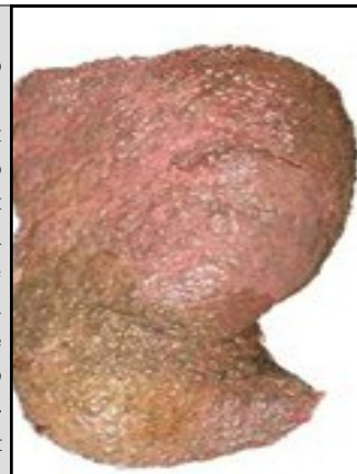
Печень пьющего человека

Вред алкоголя. Разрушительное воздействие на мозг. Всем известно, что злоупотребление алкоголем может иметь негативные и далеко идущие последствия для здоровья. Вред алкоголя проявляется, начиная от банальных провалов в памяти и заканчивая серьёзными болезнями, которые могут привести к необходимости пожизненного нахождения на лечении в клинике. Однако, как показали результаты последних научных исследований влияния приёма алкоголя на поведение за рулём, даже умеренное потребление спиртного крайне вредно для организма. Для женщин многие последствия приёма алкоголя протекают тяжелее, чем для мужчин. Некоторые клинические исследования показали, что вред алкоголя значительно агрессивней по отношению к женщинам, чем к мужчинам потому, что у женщин-алкоголичек намного быстрее, чем у мужчин-алкоголиков, развивается