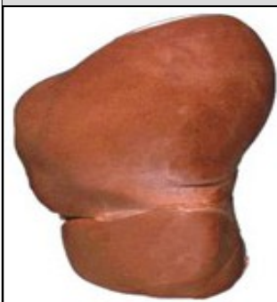
Печень здорового человека

цирроз печени, ослабление сердечной мышцы под действием алкоголя (например, кардиомиопатия) и поражение нервной системы (к примеру, периферическая невропатия). Однако исследования, в рамках которых рассматривалось влияние алкоголя на клетки головного мозга, не позволяют сделать вывод о том, что женский мозг больше восприимчив к вредному воздействию алкоголя, чем мужской. Для людей, которые регулярно принимают большие дозы алкоголя в течение длительного периода времени, существует большой риск получить вред алкоголя в виде нарушения деятельности головного мозга, связанного с повреждением мозговых клеток. Нарушение деятельности мозга может стать результатом как собственно приёма самого алкоголя, так и возникнуть под влиянием вредных последствий злоупотребления спиртным, приводящих к ухудшению общего состояния организма, а также в результате серьёзных заболеваний печени на почве алкоголизма.