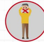
РАК ГУБЫ, ЯЗЫКА