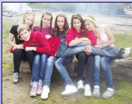
8а на привале.

После прохождения тропы все классы организовали костры. Веселье продолжалось. Кто-то играл, кто-то пел, кто-то ел.